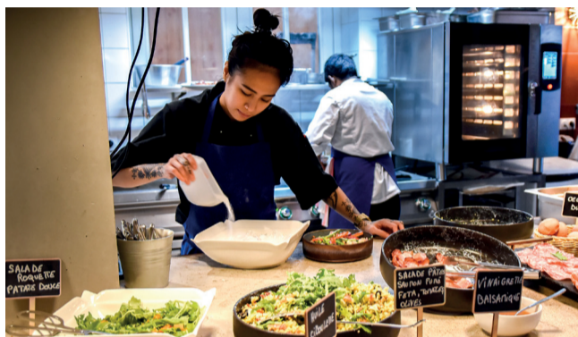
Un brunch, du jazz live, quoi d'autre ?

L'assiette froide se compose elle de viennoiseries, d'une salade de fruits, d'un pancake, de muffins et brownies ainsi que d'une sélection de charcuterie et fromage.