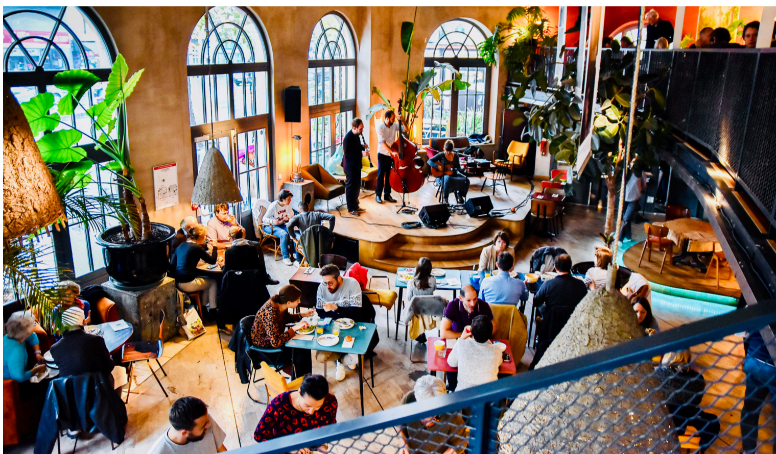
Ancien hall de gare, nouveau lieu pour les gourmands

Explorateurs, gourmands, curieux, embarquement immédiat Porte d'Orléans!